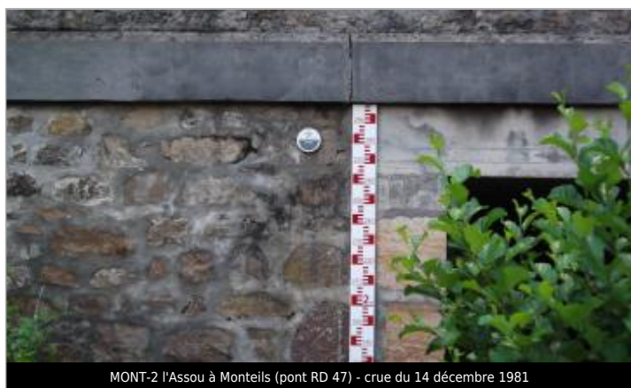
MONT-2 l'Assou à Monteils (pont RD 47) - crue du 14 décembre 1981