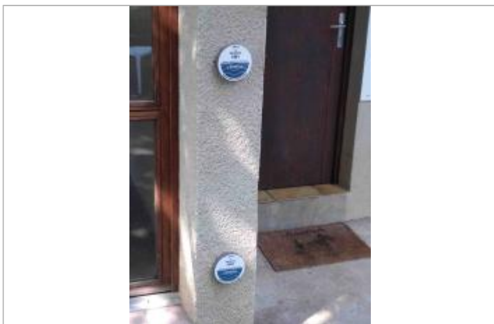
COMP-2 l'Aveyron au niveau du bâtiment d'accueil du camping (repère haut)