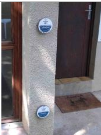
COMP-2 L'Aveyron au niveau du bâtiment d'accueil du camping (repère haut)

Altitude calculée de l'eau (en m) : 368.29 m