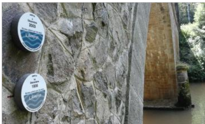
LOUB-1 : L'Aveyron à La Loubière (pont RD563) - crue du 4 décembre 2003