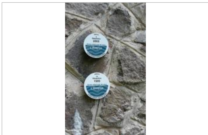
LOUB-1 : l'Aveyron à La Loubière (pont RD563) - crue du 14 décembre 1906