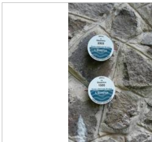
LOUB-1 : l'Aveyron à La Loubière (pont RD563) - crue du 14 décembre 1906