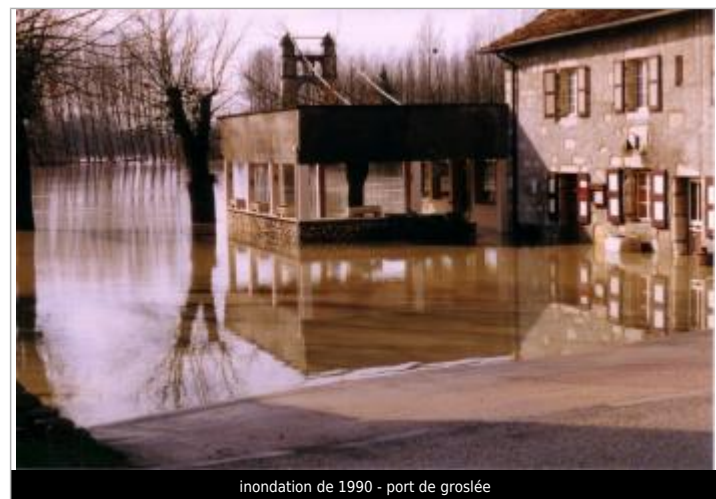
inondation de 1990 - port de groslée