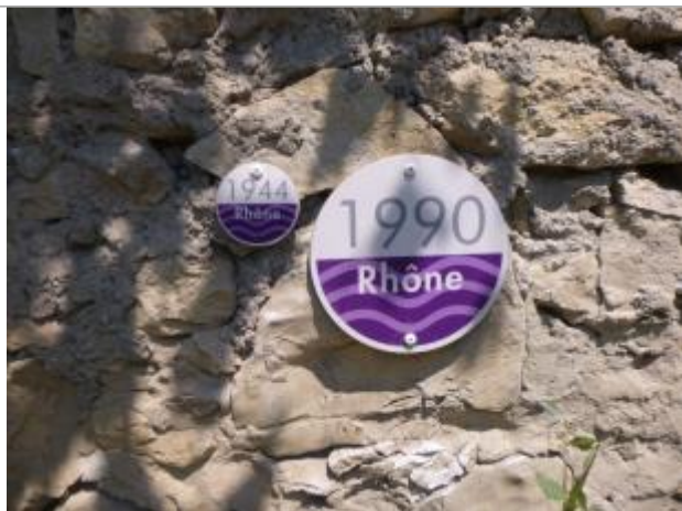
mur de la grange