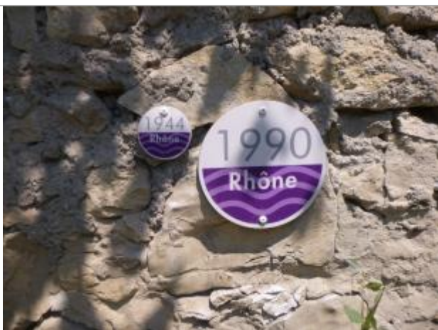
mur de la grange