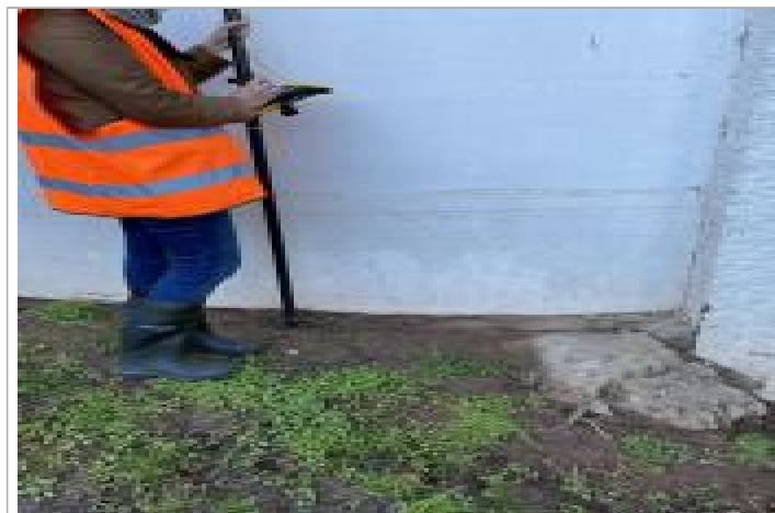
Repère posé sur borne en granit

Altitude calculée de l'eau (en m) : 103.18 m