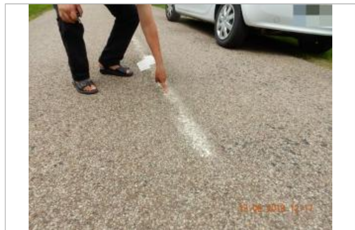
Niveau maximum atteint d'après le témoignage

MARQUE Maximum de l'inondation : Oui Visibilité : Oui Repère calculé : Non