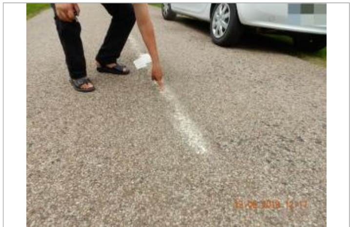
Niveau maximum atteint d'après le témoignage

MARQUE Maximum de l'inondation : Oui Visibilité : Oui Repère calculé : Non