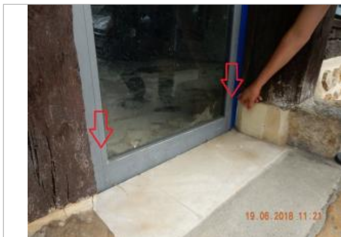
Laisses d'inondation sur la porte

Altitude calculée de l'eau (en m) : 169.17 m