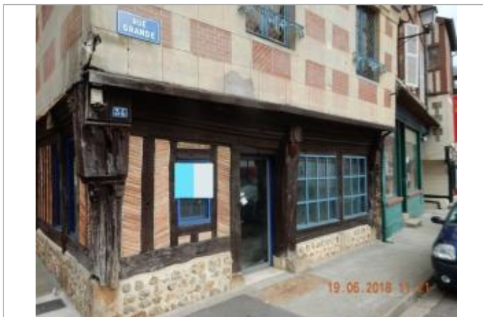
N°34 rue Grande