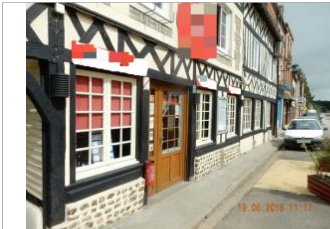
N°28 rue Grande