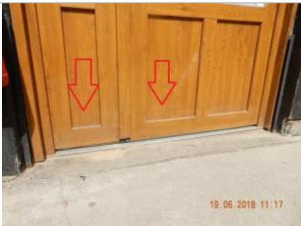
Laisses d'inondation sur la porte

Altitude calculée de l'eau (en m) : 169.06 m