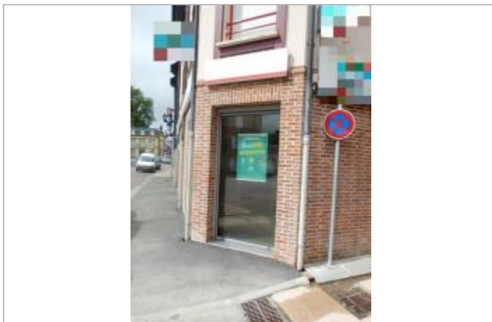
A l'angle de la rue Saint-Jacques et de la rue Grande