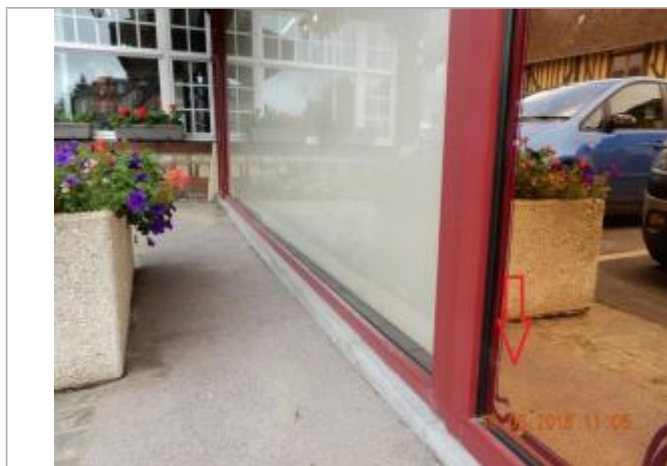
Laises d'inondation sur la vitre

Altitude calculée de l'eau (en m) : 168.97 m