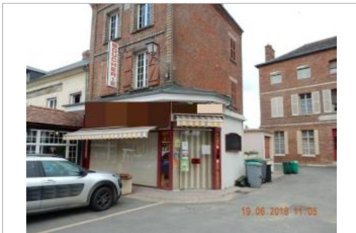
N°11 rue Grande