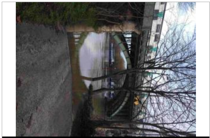
Pont du Chemin de fer depuis l'île de Chatou