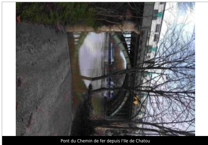
Pont du Chemin de fer depuis l'Ile de Chatou