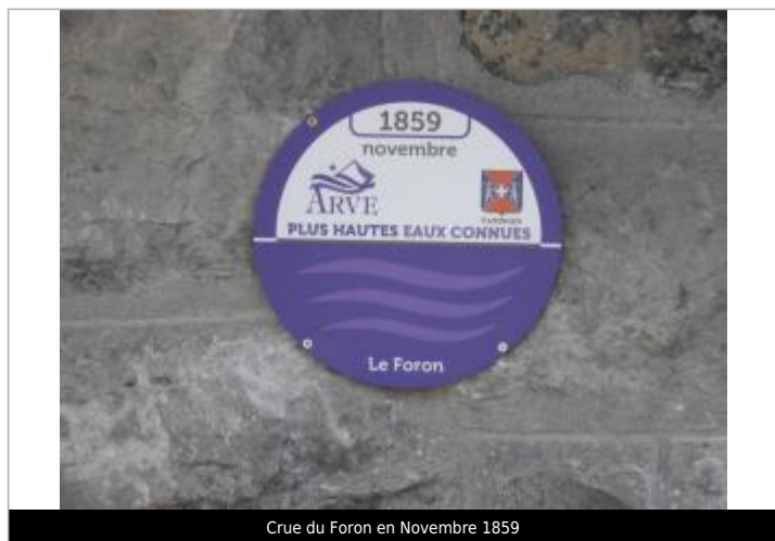
Crue du Foron en Novembre 1859