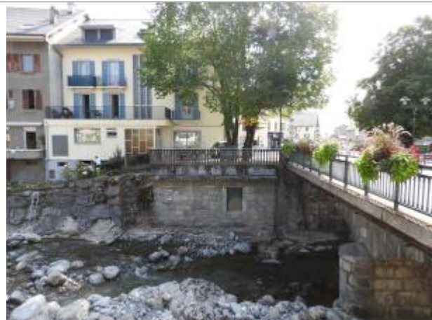
Site de pose des repères de crues historiques à Taninges