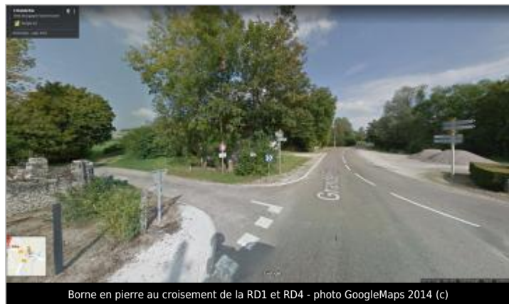
Borne en pierre au croisement de la RD1 et RD4

GÉOLOCALISATION Coordonnées WGS84 : X: 4.25651400 / Y: 47.56629700 Coordonnées RGF93 (Lambert 93) X: 794473.11 / Y: 6719187.49 Coordonnées RGF93 (ETRS89) : X: 4.256514 / Y: 47.566297 Code Hydro: F3--0210 Rive de référence: