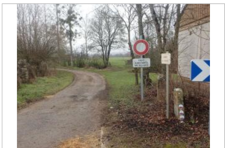
De haut en bas : 1816, 1910 et 2001

MARQUE Texte : Bassin Versant de l'Armançon - Mars 2001 - Niveau atteint par les eaux - Armançon Maximum de l'inondation : Oui Visibilité : Oui