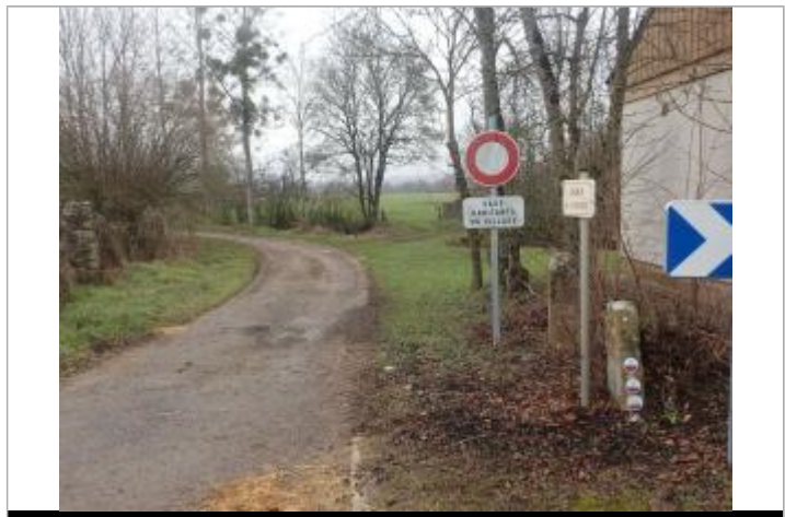
De haut en bas : 1816, 1910 et 2001

MARQUE Texte : Bassin Versant de l'Armançon - Mars 2001 - Niveau atteint par les eaux - Armançon Maximum de l'inondation : Oui Visibilité : Oui