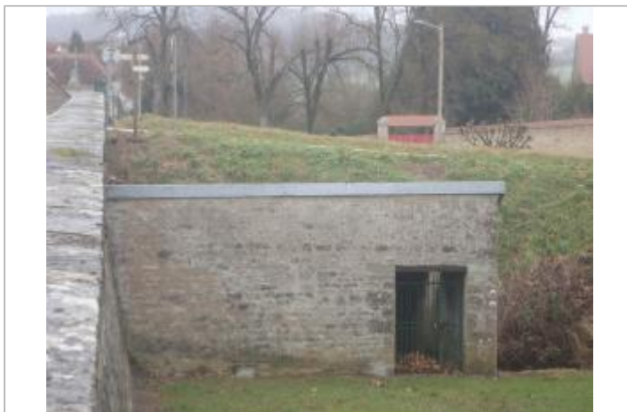
Lavoir de Buffon - SMBVA 2017 (c)