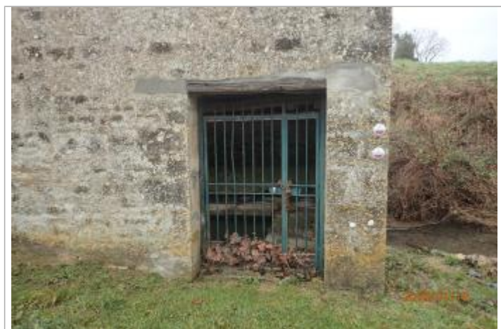
Crue de 1998 représenté par le macaron le plus bas