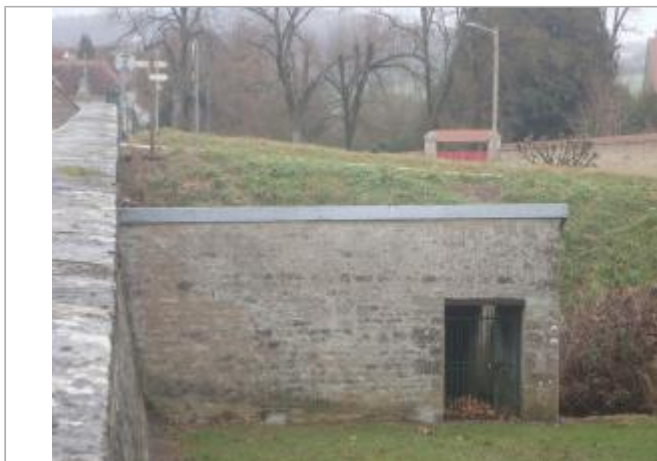
Lavoir de Buffon - SMBVA 2017 (c)