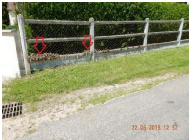
Laisses d'inondation sur le grillage

Altitude calculée de l'eau (en m) : 174.84