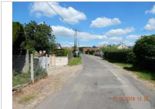
N°5 rue de la Borne