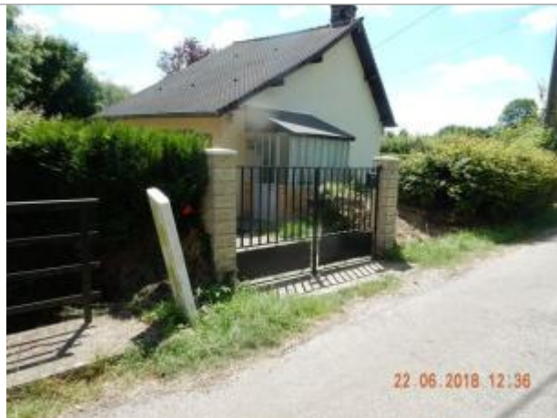
N°42 rue de la Jacterie