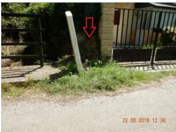
Laisses d'inondation sur la haie

Altitude calculée de l'eau (en m) : 177.6