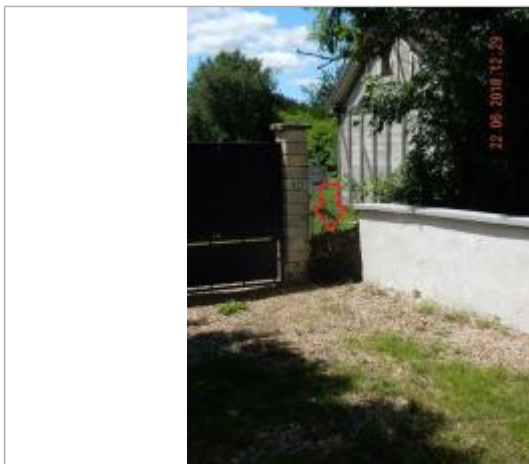
Laisses d'inondation sur le grillage

Altitude calculée de l'eau (en m) : 176.27 m