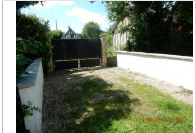
N°22 rue du Bas Ruel