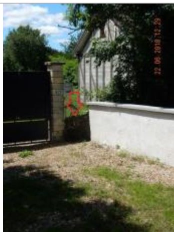
Laisses d'inondation sur le grillage

Altitude calculée de l'eau (en m) : 176.27