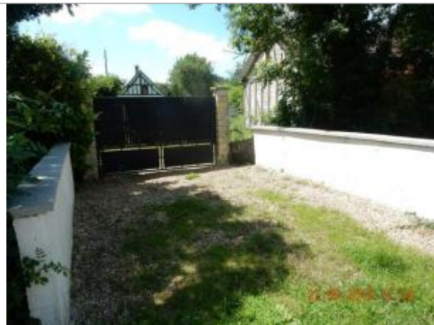
N°22 rue du Bas Ruel