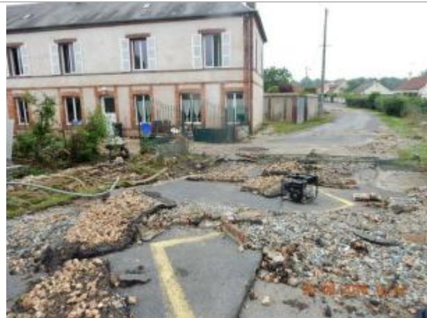
Au croisement des rues du Bas Ruel et de la Borne