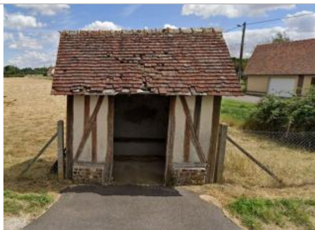
Laisse de crue sur le mur de l'abri bus

Altitude calculée de l'eau (en m) : 172.42