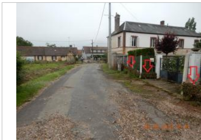
Laises d'inondation sur le grillage

Maximum de l'inondation : Oui Visibilité : Oui Repère calculé : Non Pérennité : Aucune