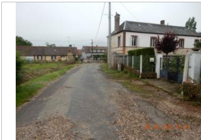
N°3 rue de la Borne