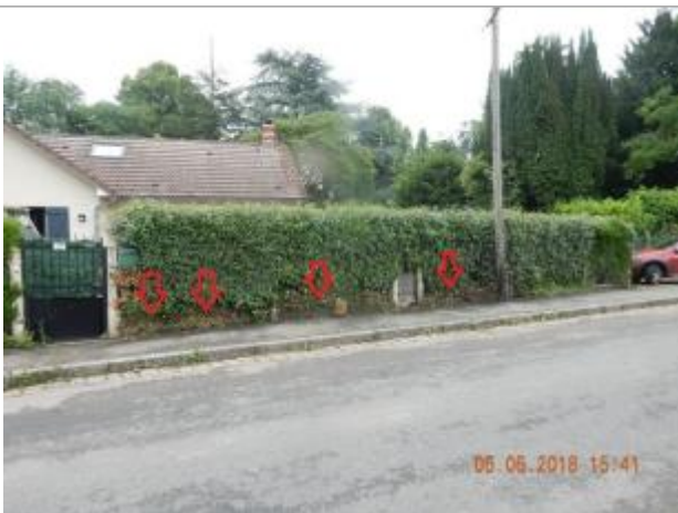
Laisses d'inondation sur la haie

Altitude calculée de l'eau (en m) : 170.34