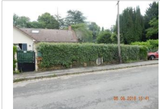
N°40 rue du Fourneau

Coordonnées WGS84 : X: 0.91309251 / Y: 48.83196010