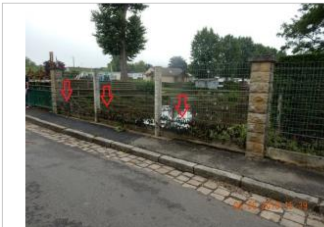
Laisses d'inondation sur le grillage

Altitude calculée de l'eau (en m) : 170.63 m