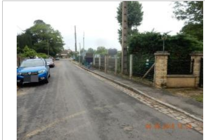
Pont rue du Fourneau