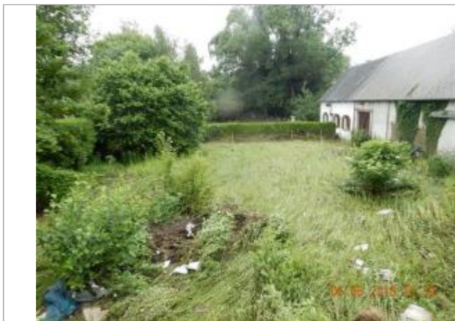
A proximité du n°94 rue du Fourneau (SPC SACN)

Coordonnées WGS84 : X: 0.91321238 / Y: 48.83251020