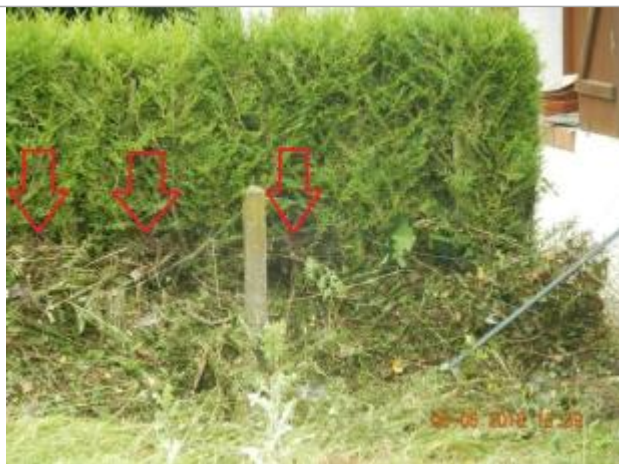
Dépôt de brindille sur la haie

Altitude calculée de l'eau (en m) : 168.21 m