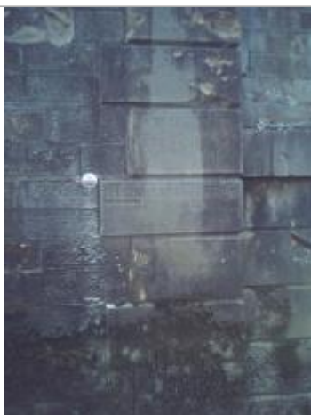
Repère normalisé 2013 - Photo SMBVA 2016 ©

Altitude calculée de l'eau (en m) : 170.676 m