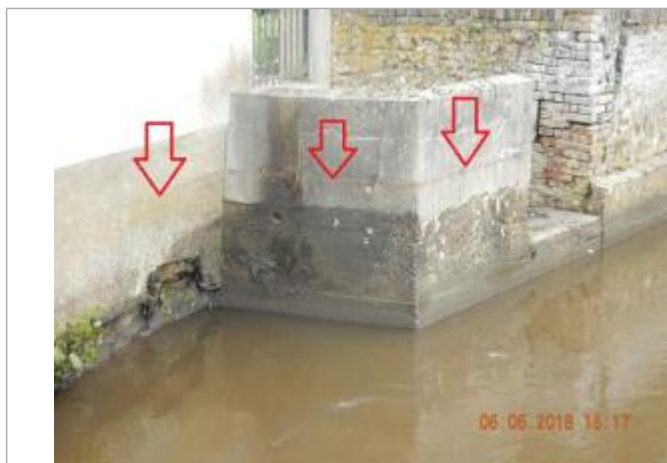
Laisse d'inondation sur le mur

SOURCE DE REPÉRAGE : CAMPAGNE DE TERRAIN SPC SACN DU 6 JUIN 2018 - 06/06/2018