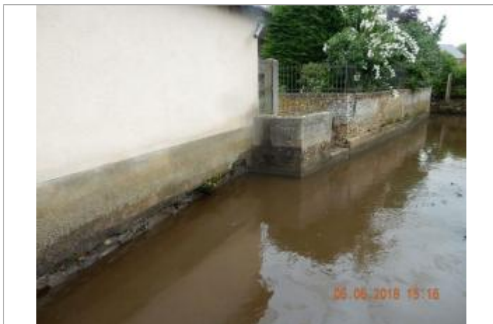
N°604 rue du Moulin