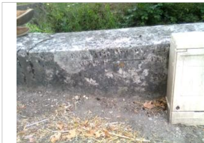
Repère gravé 1866