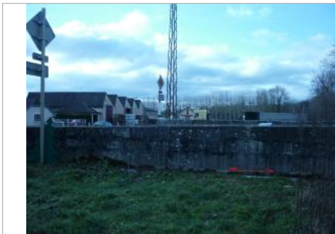
Pont RD vu de l'amont rive gauche