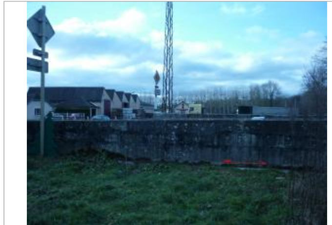
Pont RD vu de l'amont rive gauche