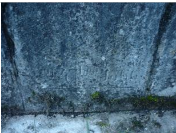
Repère gravé 1866

Altitude calculée de l'eau (en m) : 175.17