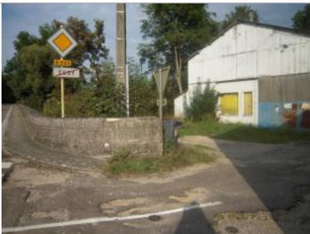
Repère normalisé 1866

Altitude calculée de l'eau (en m) : 175.17