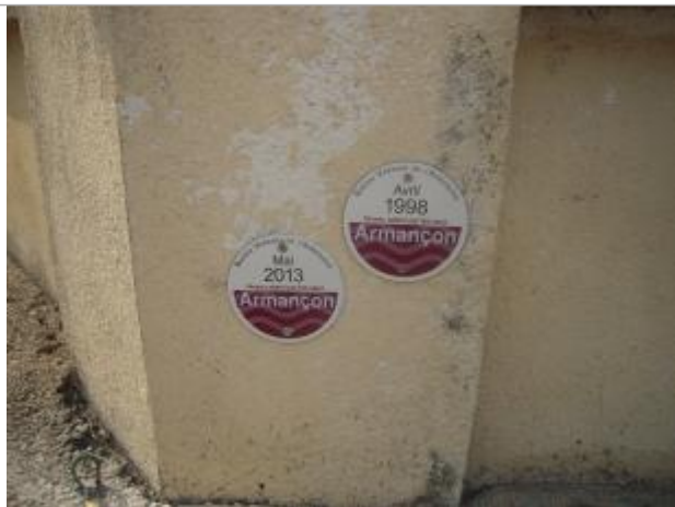
Repères 2013 et 1998 (zoom) - Photo SMBVA ©