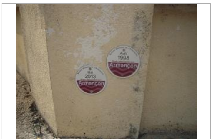
Repères 2013

MARQUE Texte : Bassin Versant de l'Armançon - Mai 2013 - Niveau atteint par les eaux - Armançon Visibilité : Oui