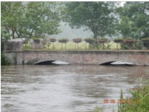
Quelques heures avant le maximum de la crue

Organisme : SPC Seine aval - Côtiers normands