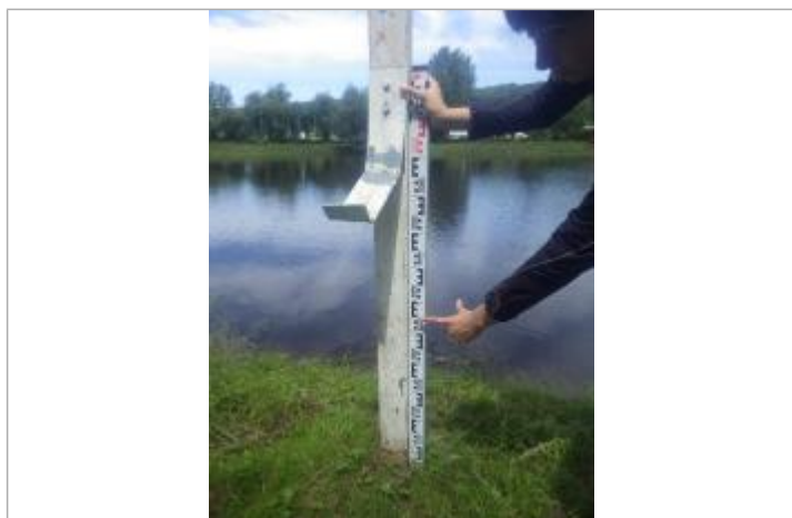
Trace d'inondation à 55 cm sur le piquet à partir du sol

Altitude calculée de l'eau (en m) : 43.43 m