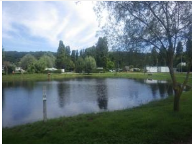
Piquet métallique