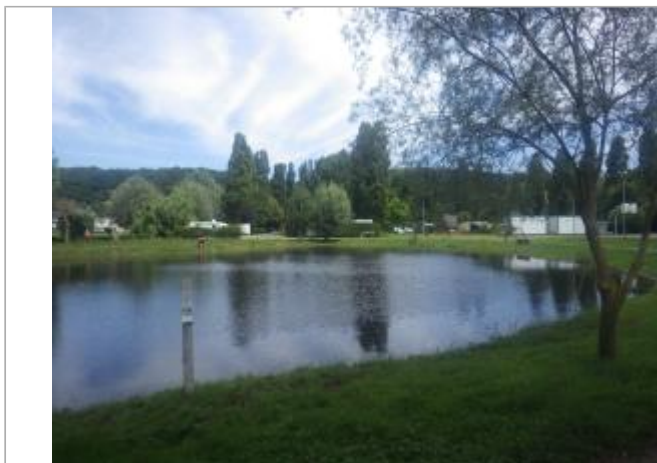
Piquet métallique