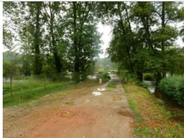
Le Petit Sacq, à proximité du pont