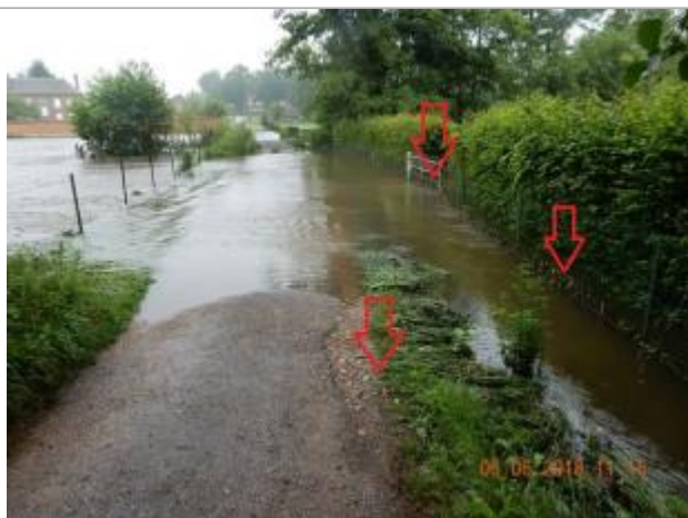
Laiesses d'inondation sur la route et les clôtures

Altitude calculée de l'eau (en m) : 125.8