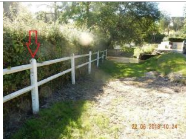
Barrières à proximité du pont