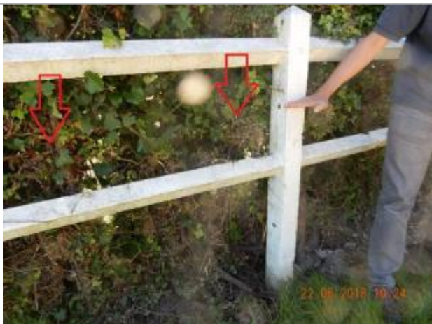
Dépôt de brindilles sur la végétation

Altitude calculée de l'eau (en m) : 136.536 m