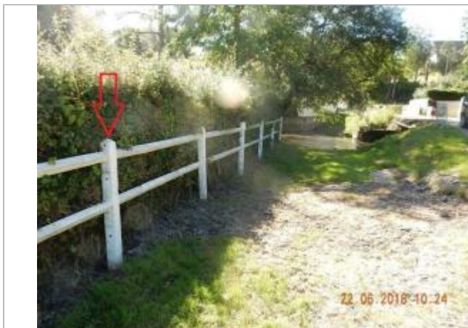
Barrières à proximité du pont