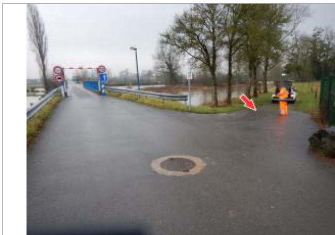
Site et repère de la crue de janvier 2018

Coordonnées WGS84 : X: 3.98950400 / Y: 46.49594700