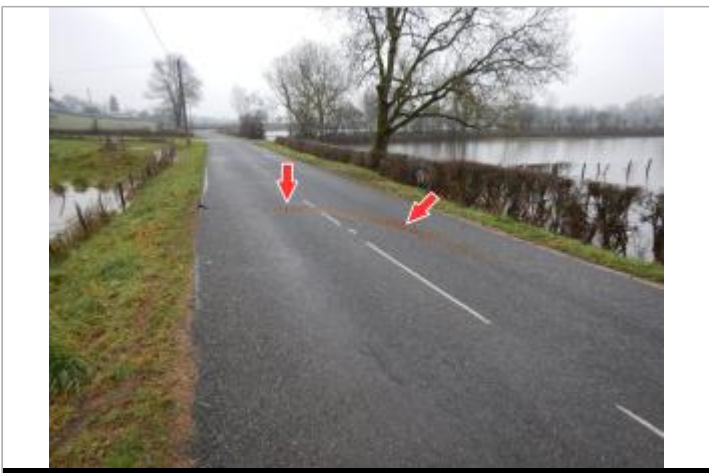
Site et repère de la crue de janvier 2018

GÉOLOCALISATION Coordonnées WGS84 : X: 3.97584600 / Y: 46.49430700 Coordonnées RGF93 (Lambert 93) X: 774843.3 / Y: 6599830.24 Coordonnées RGF93 (ETRS89) : X: 3.975846 / Y: 46.494307 Code Hydro: K1--0180 Rive de référence: Droite