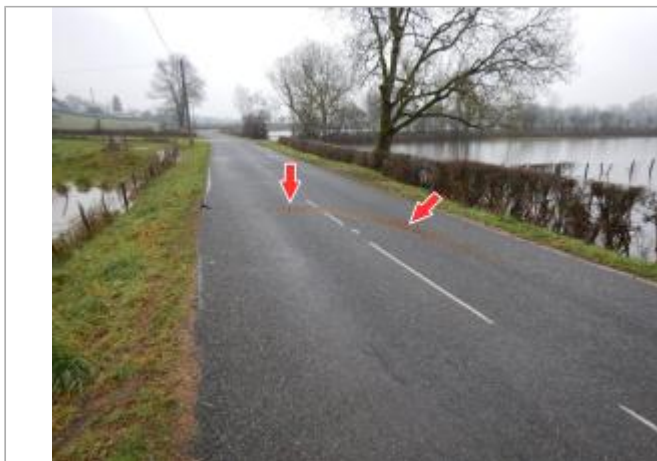
Site et repère de la crue de janvier 2018

Coordonnées WGS84 : X: 3.97584600 / Y: 46.49430700