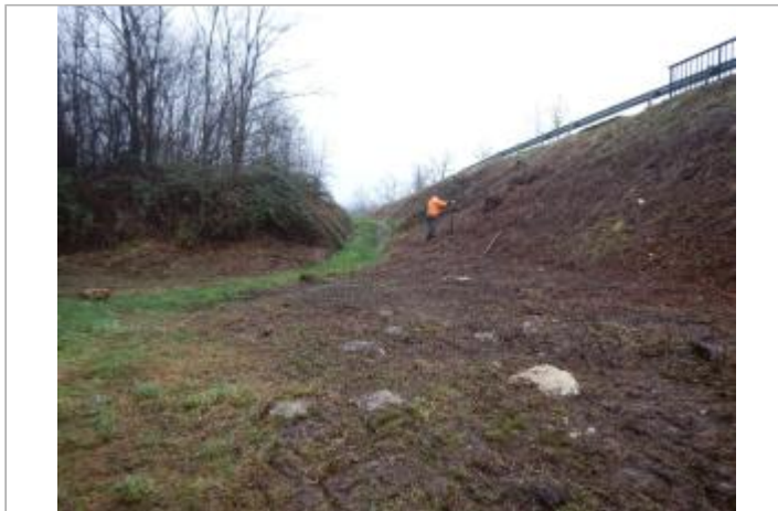
Site et repère de la crue de janvier 2018