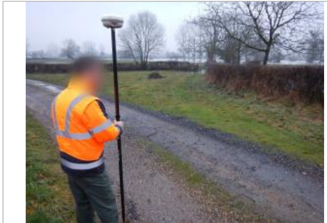
Site et repère de la crue de janvier 2018

Coordonnées WGS84 : X: 4.00527900 / Y: 46.50362200