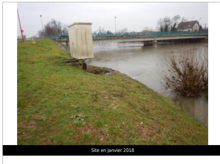
Site en janvier 2018