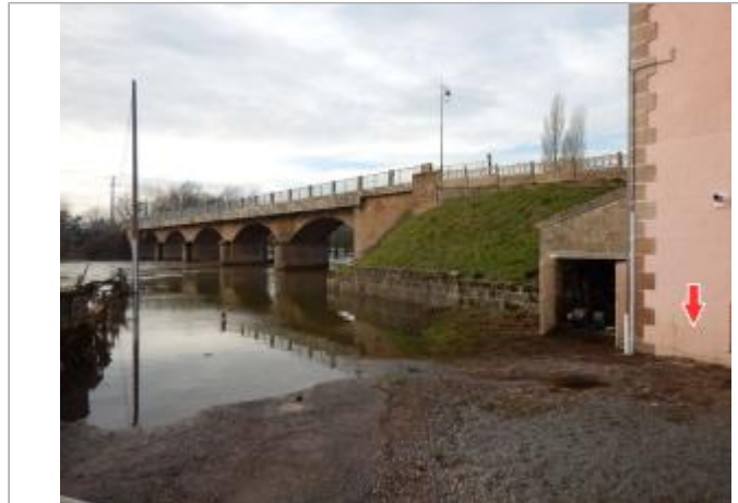
Site et repère de la crue de janvier 2018