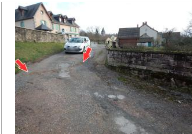
Site et repère de la crue de janvier 2018