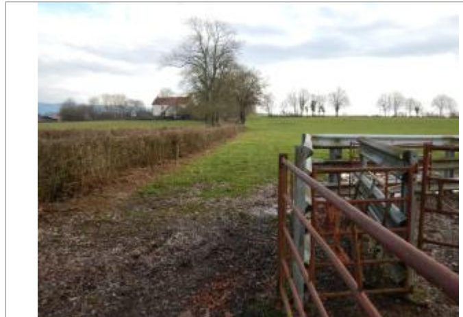
Site pendant la crue de janvier 2018

Coordonnées WGS84 : X: 4.17012700 / Y: 46.82852500