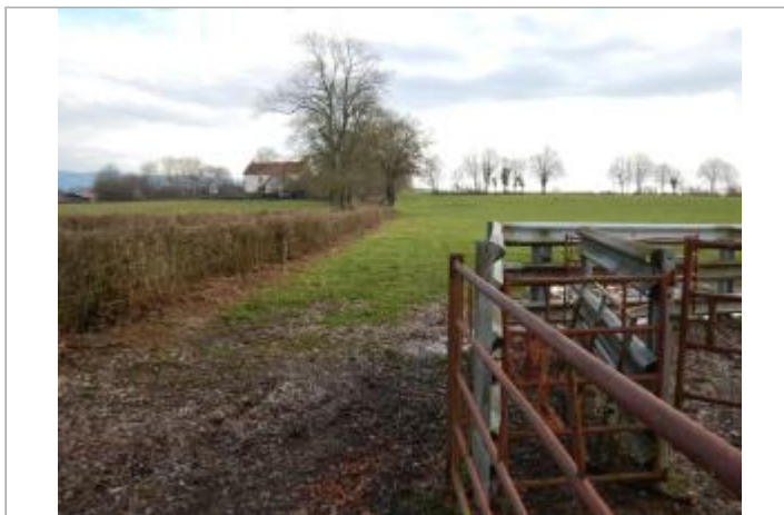
Site pendant la crue de janvier 2018