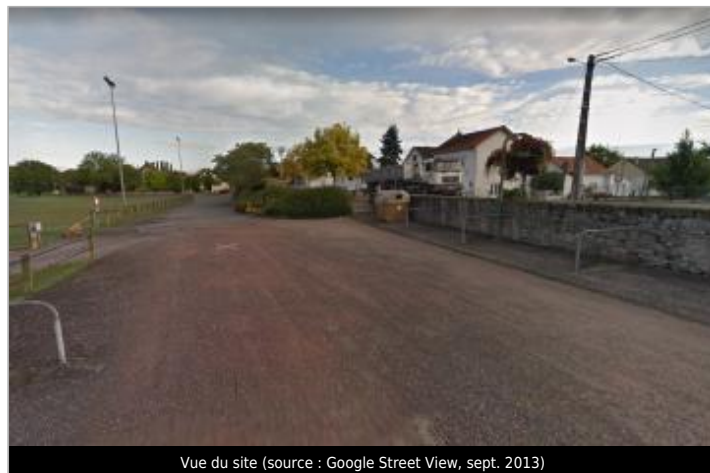
Vue du site