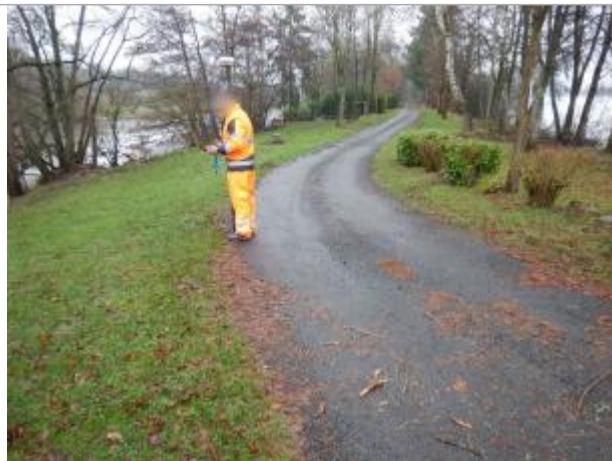
Site et repère de la crue de janvier 2018