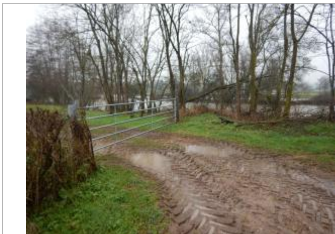
Portail d'accès au site