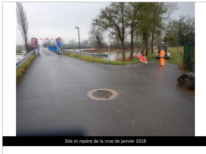
Site et repère de la crue de janvier 2018