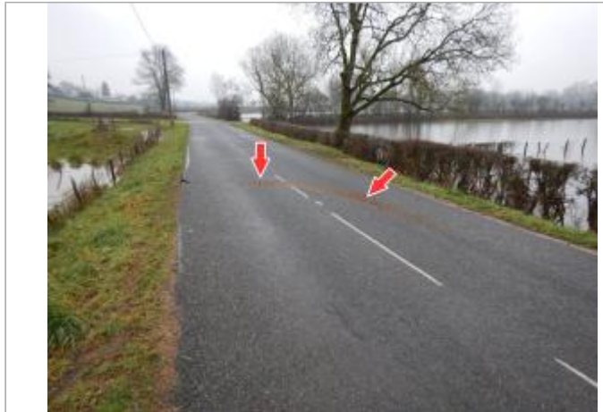
Site et repère de la crue de janvier 2018

Coordonnées WGS84 : X: 3.97584600 / Y: 46.49430700